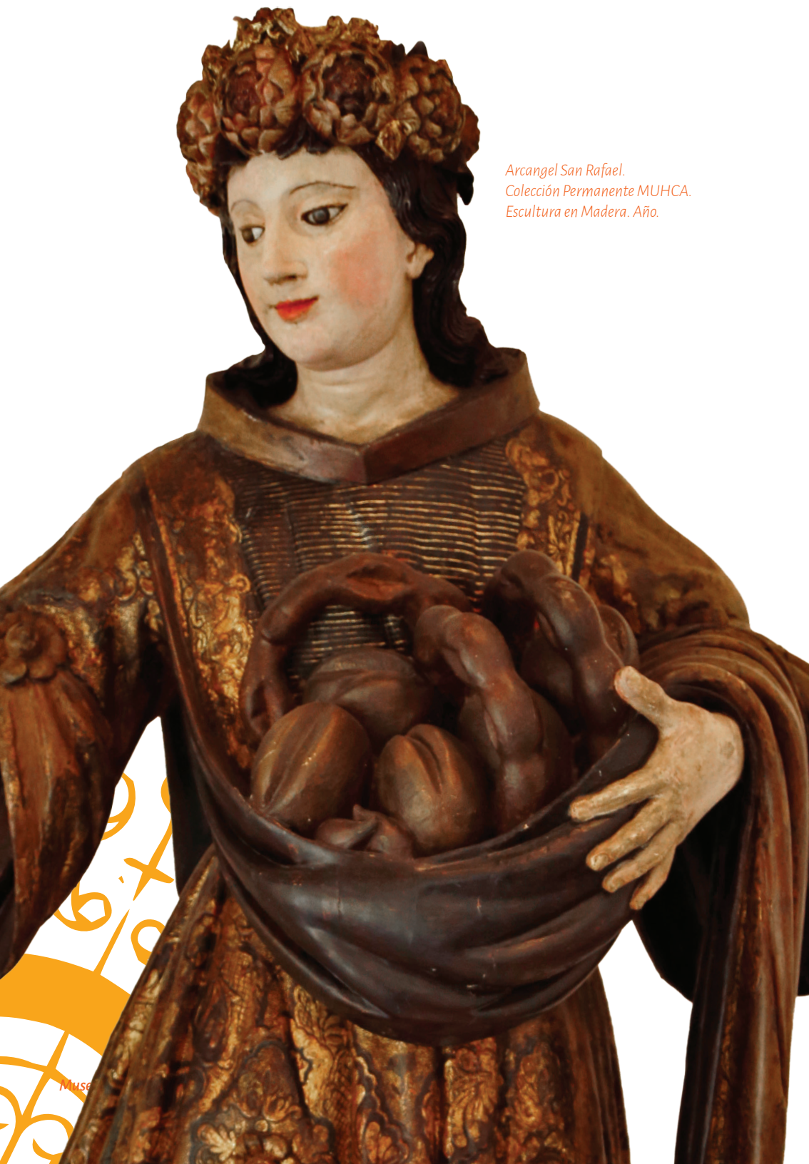
Arcangel San Rafael. Colección Permanente MUHCA. Escultura en Madera. Año.