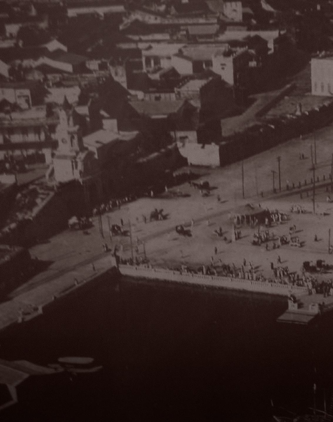
información de la imagen: origen. Archivo. año. etc.