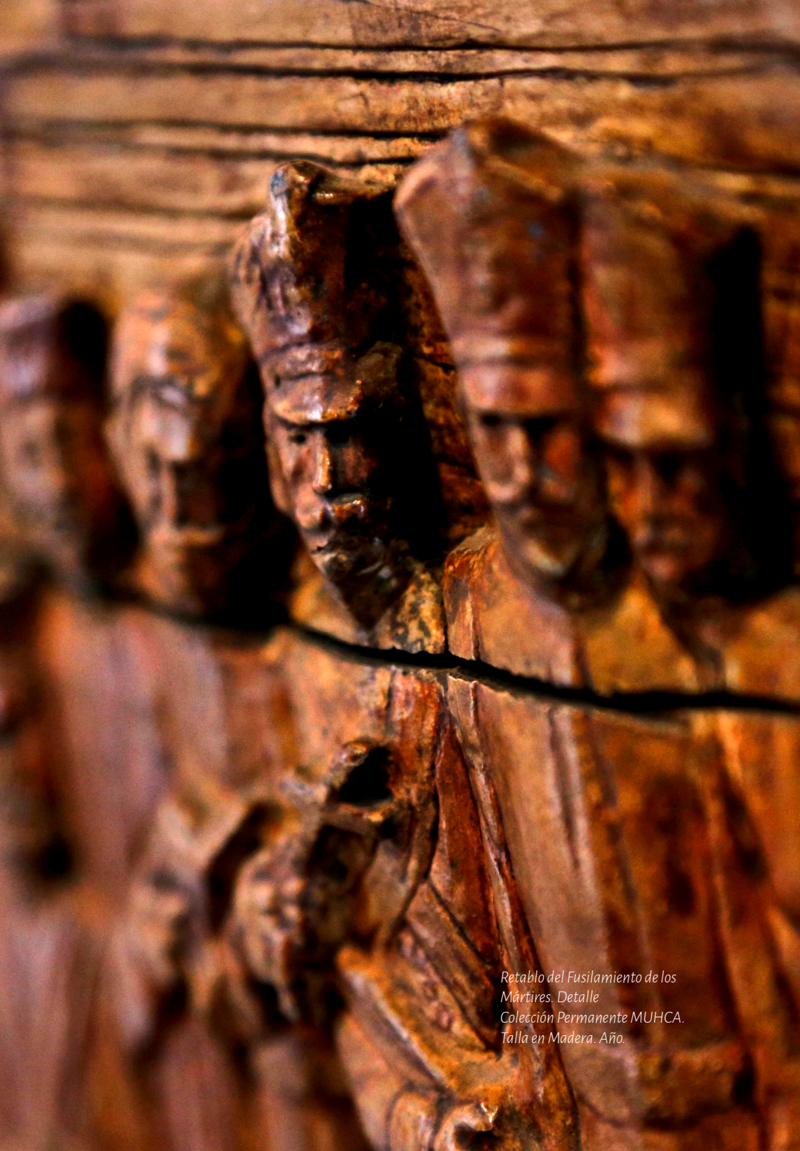
Retablo del Fusilamiento de los Mártires. Detalle Colección Permanente MUHCA. Talla en Madera. Año.