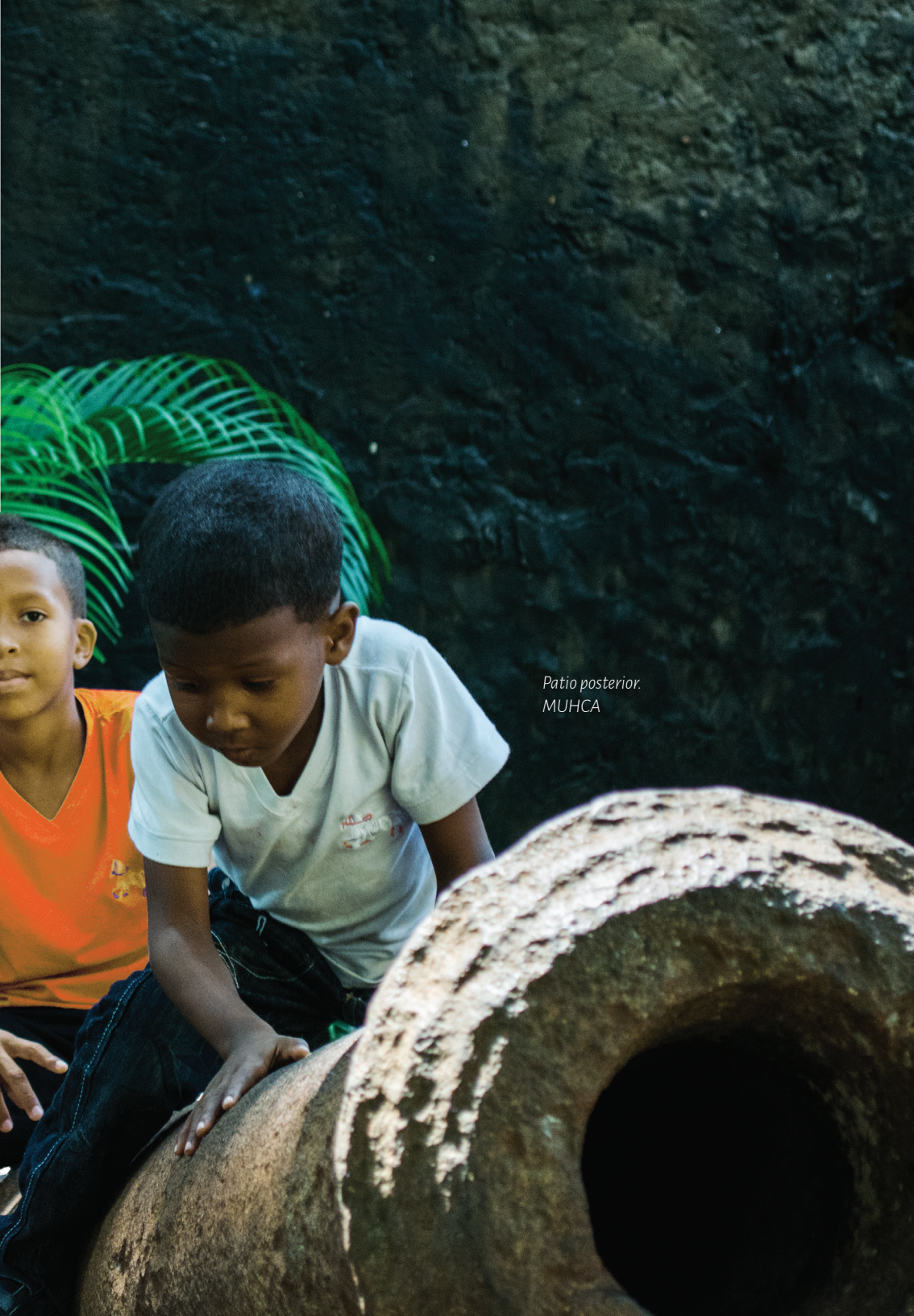
Patio posterior. MUHCA